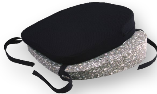
Kildyna för köksstol.